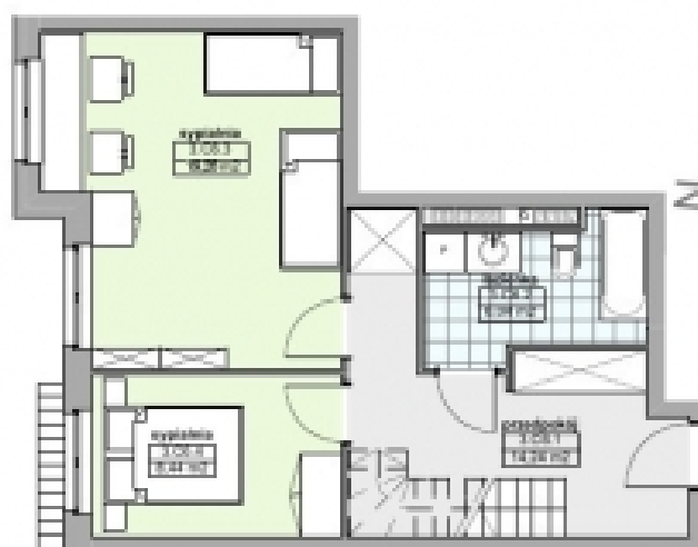
rzut III piętra