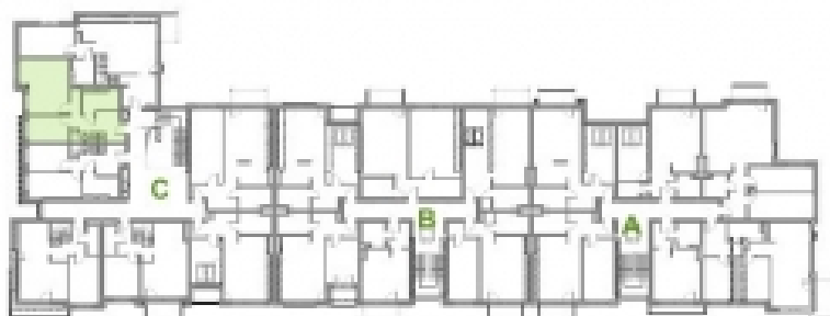
RZUT IV PIĘTRA