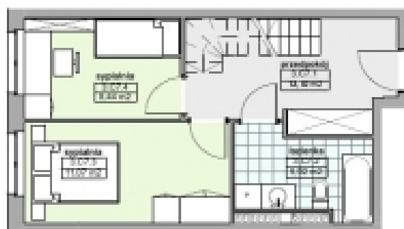
rzut III piętra