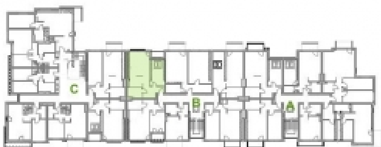
RZUT III PIĘTRA