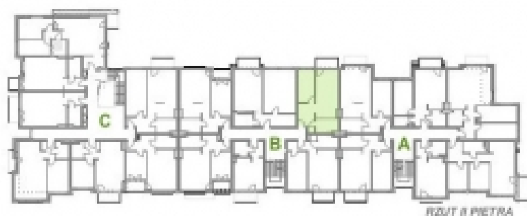
RZUT II PIĘTRA