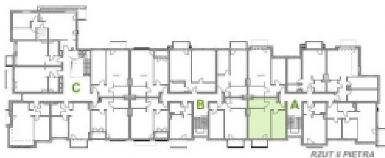
RZUT II PIĘTRA